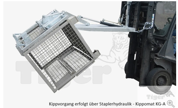
Kippvorgang erfolgt über Staplerhydraulik - Kippomat KG-A