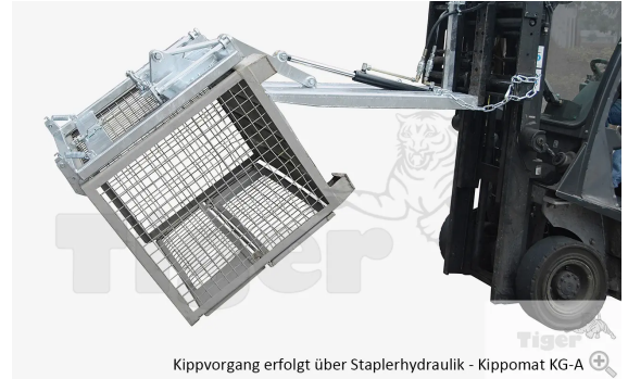
Kippvorgang erfolgt über Staplerhydraulik - Kippomat KG-A